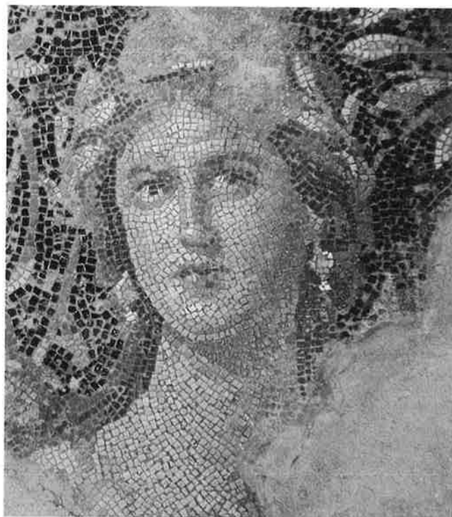
Mozaïek uit Pompeji.

Een eerste probleem in de waardering van de elegieën is dat Sulpicia tot 1835 niet als auteur erkend werd. De gedichten zijn overgeleverd in de Appendix Tibulliana en werden traditioneel toegeschreven aan mannelijke auteurs als Tibullus en Ovidius. Traditioneel, omdat geloofd werd dat vrouwen niet konden schrijven. Onder andere door deze misvatting is modern historisch onderzoek pas laat op gang gekomen. Dit onderzoek maakt evenwel duidelijk dat er geen reden is om te twijfelen aan de authenticiteit van een vrouwelijke auteur Sulpicia. Ook in de Romeinse traditie waren vrouwen literair