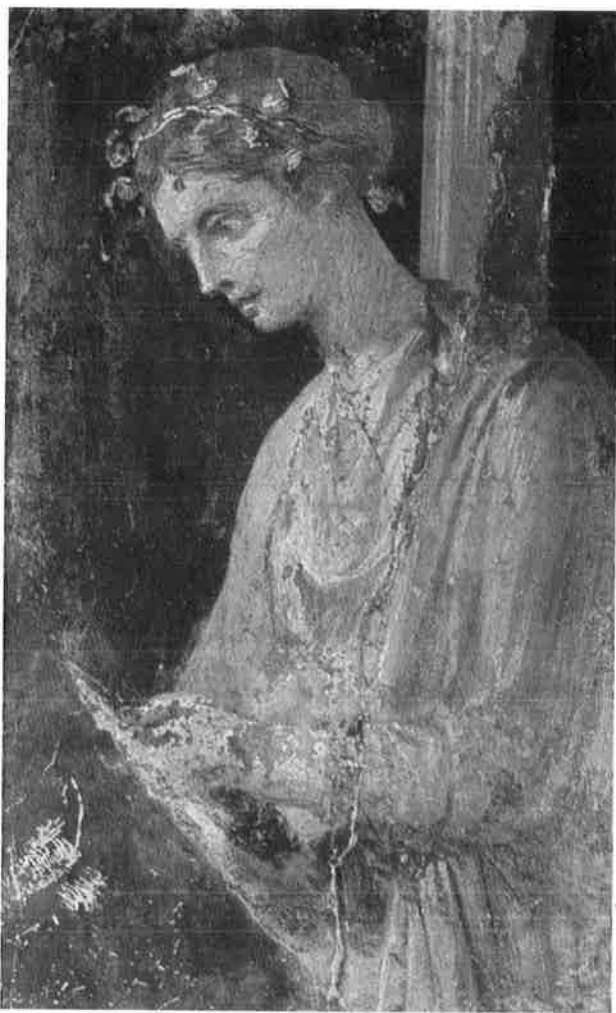
Fresco uit Pompeji.

is er hier in sommige gevallen sprake van een overwaardering. Enkel haar bijzondere positie als vrouw zorgt al voor een positieve waardering van het werk.