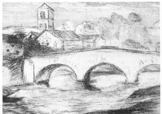
Ets van de hand van Fles (Ponte Fabricio uit haar Album Roma, circa 1909).

In 1880 begon Etha haar schildersopleiding aan de Rijksacademie voor Beeldende Kunsten in Amsterdam (de huidige Rietveldacademie). Zij maakte deel uit van de eerste