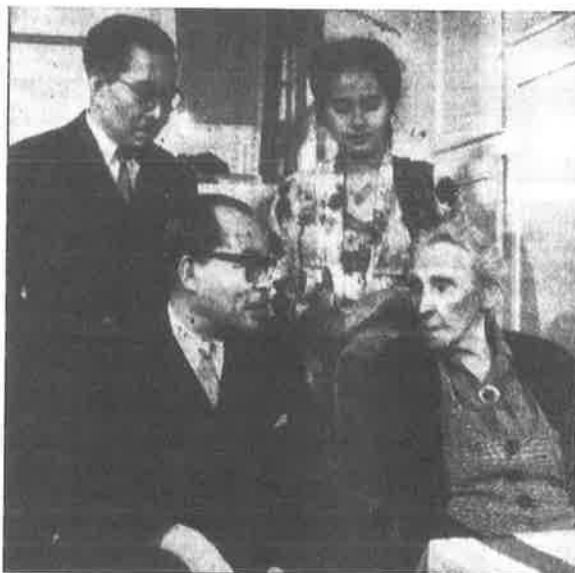
Op 8 november 1949 verscheen in Het Vrije Volk een foto van het bezoek van Hatta aan Roland Holst, met daarboven de tekst: 'Mensen ontmoeten elkaar..'

'Ik ga Henr. Roland Holst nog opzoeken', stond 5 november 1949 met grote letters op de voorpagina van Het Vrije Volk boven een interview met Mohammed Hatta. De foto bij het artikel toonde een onberispelijk geklede, kleine Indonesische man, gezeten in een veel te grote fauteuil, die vanachter dikke brillenglazen verbaasd de wereld inkeek. Hij kwam de Nederlandse krantenlezers inmiddels bekend voor. Bijna dagelijks waren in de voorafgaande maanden foto's van Hatta in de krant verschenen, want hij was de leider van de Indonesische Republikeinse delegatie die tijdens de Ronde Tafel Conferentie in Den Haag onderhandelde over de Nederlandse soevereiniteits-overdracht aan Indonesië. Deze moeizame onderhandelingen waren begin november eindelijk officieel afgerond.