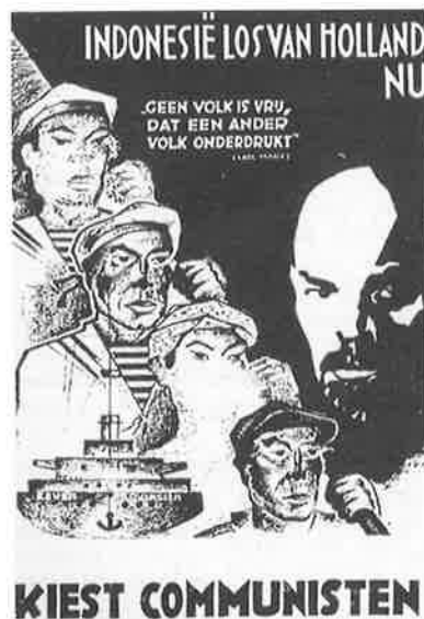
Indonesië los van Holland nu.

Hier lag de kans de ideeën van de PI aan een breed publiek te presenteren en het vacuüm binnen de Indonesische onafhankelijkheidsbeweging -dat na het oprollen en het verbod van de PKI was ontstaan- op te vullen. Daarom was de nadrukkelijk niet-communistische PI hier wél aanwezig met een ruime afvaardiging, ondanks het feit dat de organisatie van het congres in handen lag van Willy Münzenberg, een vertegenwoordiger van de Komintern (Communistische Internationale). Hatta hield een gloedvol betoog waarin hij het Nederlandse kolonialisme aan de kaak stelde. Hij sloot vriendschap voor het leven met Nehru, de latere premier van India. Samen met hem nam Hatta zitting in het Uitvoerend Comité van de Liga. Henriette Roland Holst was op het congres alleen als toehoorder aanwezig geweest. Terug in Nederland sloot ze zich aan bij de Nederlandse sectie van de Liga.