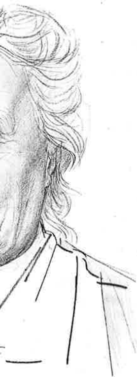
Jan Toorop (1927)